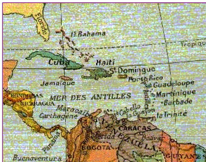
Les Grandes Antilles ( LAROUSSE universel 1922 )